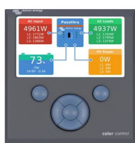
Color Control GX