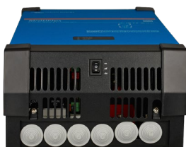
MultiPlus 2 000 VA (with bottom cover)