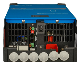
MultiPlus 2 000 VA (protection du bas retirée)