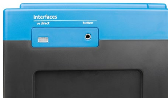
VE.Direct et bouton-poussoir