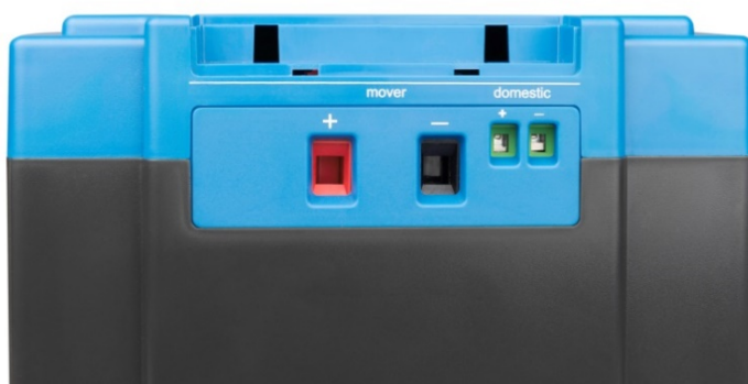
Sortie à haute capacité (système de déplacement motorisé) et sortie à