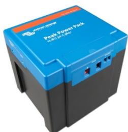
12,8 V, 30 Ah