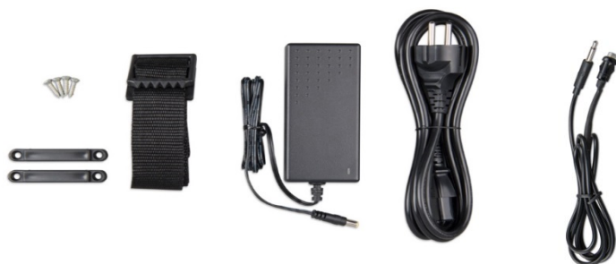
Sangle de fixation Adaptateur Câble d'alimentation Bouton-poussoir avec câble (2 m) et voyant LED à deux couleurs