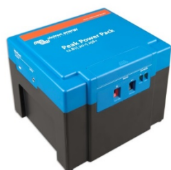
12,8 V, 20 Ah