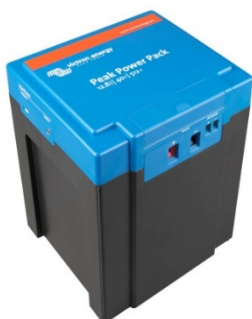
12,8 V, 40 Ah